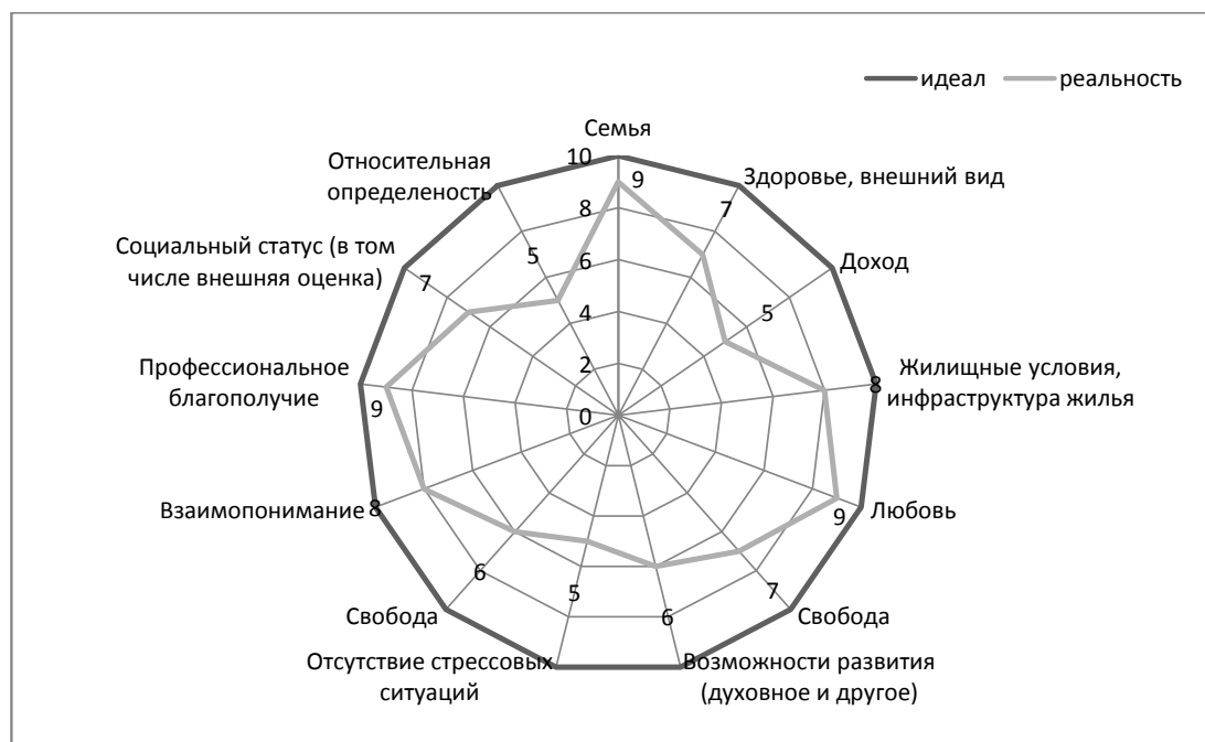
Рис. 1. Оценивание факторов субъективного благополучия, выделенных участниками фокус-групп «Анализ факторов субъективного благополучия НПП, составляющие профессиональной идентичности»

При этом был выявлен парадокс, заключающийся в том, что при обращении на первом этапе к участникам как индивидам, личностям, без акцента их внимания на профессиональной принадлежности, с просьбой выявить факторы субъективного благополучия в целом фактор дохода (бюджет и другое) был идентифицирован 88% участников. Затем в этот этап проведения фокус-групп был включен профессиональный дискурс и ориентация на профессиональную оценку субъективного благополучия. Переход на профессиональный дискурс поменял значимость факторов благополучия, т.е., как только к социальным и личностным факторам добавился фактор благополучия в профессии, доход утратил свою значимость и был указан только 13% участников. Это свидетельствует о том, что доход имеет значение в жизни НПП в целом, но в профессии гораздо более значимыми ими признаются иные факторы, рассмотренные ниже, например, призвания. Это дает возможность анализировать сочетание экономических и неэкономических мотивов поведения индивидов и соответствующих рациональных и иррациональных поведенческих реакций (Яковлева, 2014, с. 66).