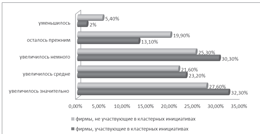
Рис. 2. Изменение в количестве новых продуктов и услуг, представленных на рынок кластерами и компаниями вне кластерных инициатив Источник: (Probst, Monfardini, Frideres and Bohn, 2013).

Важным позитивным эффектом интеграции является снижение транзакционных издержек при использовании партнерских технологий инновационного промышленного развития. В первую очередь речь идет о сокращении затрат на поиск информации о поставщиках и потребителях, на ведение переговоров и заключение контрактов, снижении издержек оппортунистического поведения контрагентов, контроле за соблюдением контрактов, спецификации и защиты прав собственности, уменьшении издержек на интернационализацию деятельности.