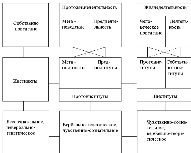
Рис. 1. Этапы коэволюции деятельности, сознания и институтов

Истоки доверия теряются в глубинах бессознательного как досознательного,